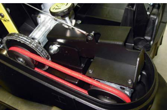
Endlos elastischer Rundriemen, PU rot im Motorraum einer Gebäudereinigungsmaschine