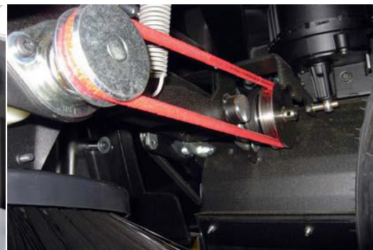
Seitenbesenantrieb einer Kehrmaschine