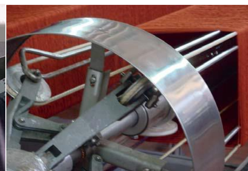
NOMEX-PTFE Hochbauschriemen in einer Textilveredlungsanlage