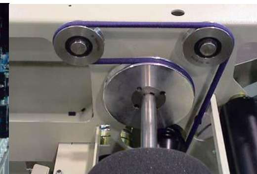
Walzenantrieb in einer Wäschefaltmaschine