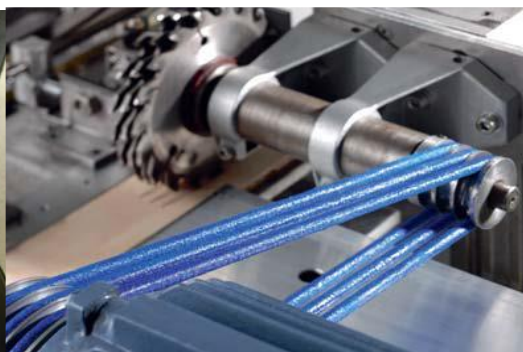
Endlos elastischer Rundriemen, PU blau in einer Holzbearbeitungsmaschine