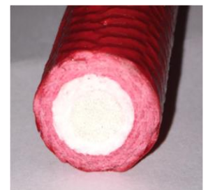
Endlos elastisch geflochtener Rundriemen

Aus diesem Grund sind Angaben auf Zeichnungen, wie Länge ungespannt, für den Wareneingang zwar grobe Anhaltswerte, jedoch nicht Qualitätsrelevant. Um hier eine korrekte Eingangs- und Qualitätskontrolle durchzuführen, müssen die Riemen auf die Nennabmessung gezogen und die Spannkraft gemessen werden. Wobei höhere Spannungswerte der Übertragungsleistung zu Gute kommen.